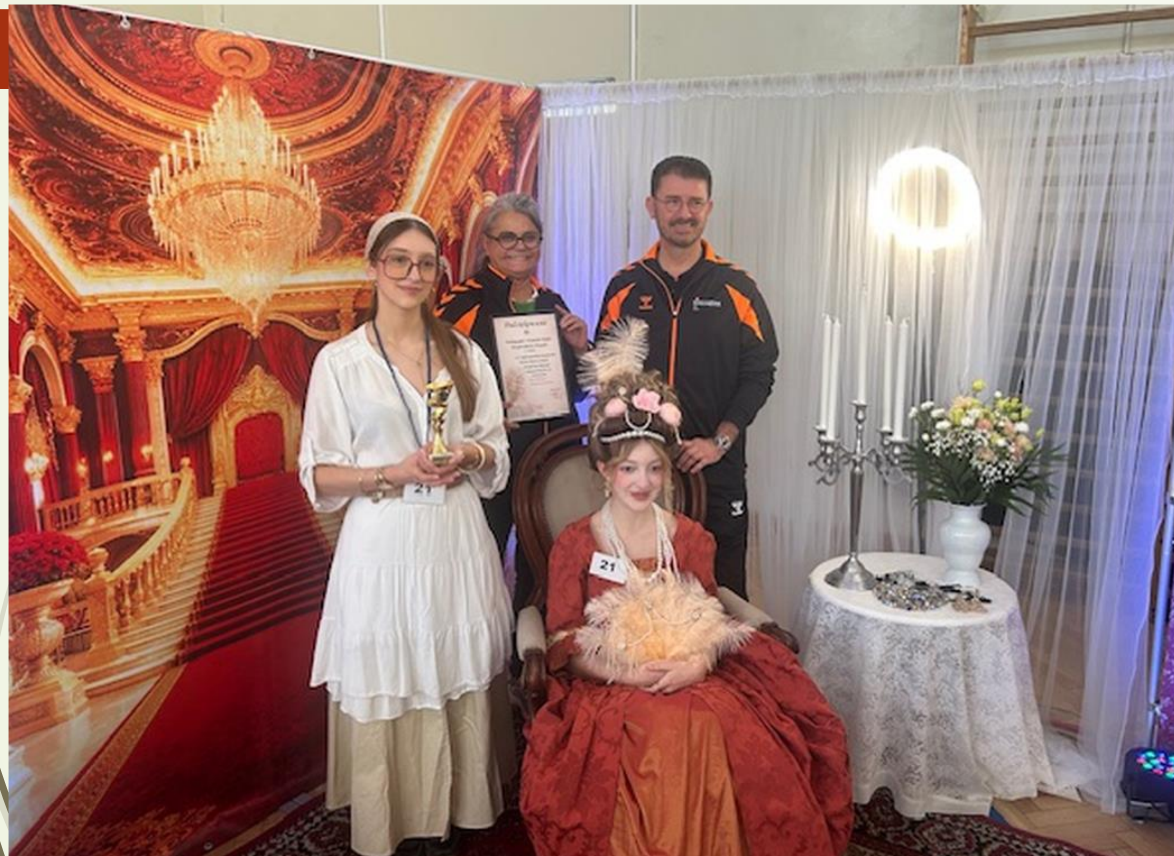
Photo de groupe Lycée Jean D'Arcet