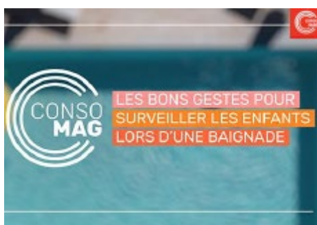
L'émission ConsoMag diffusée à partir du 17 mai