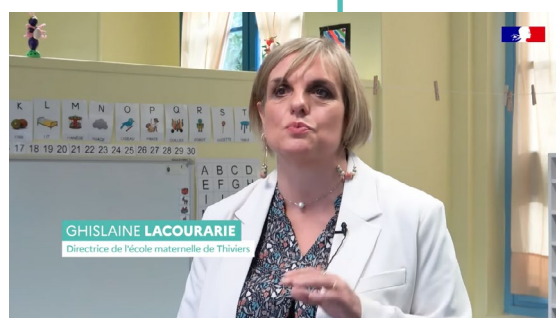
Épisode 2 École maternelle de Thiviers en Dordogne