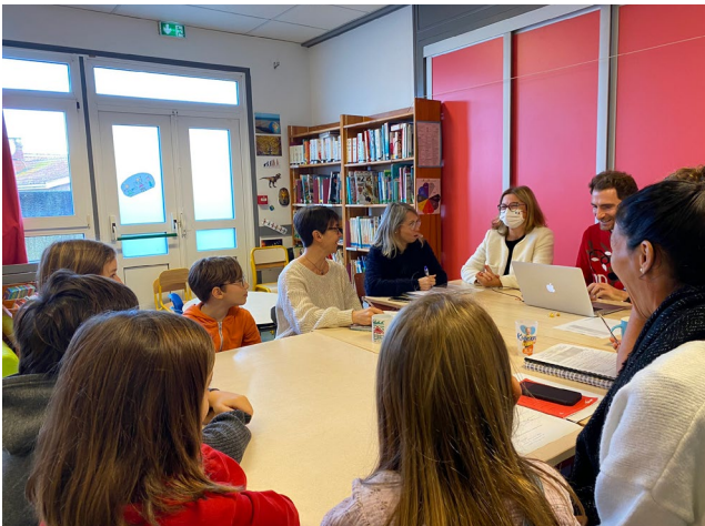
Concertation à l'école de Biscarrosse-Plage le 15/12/22.