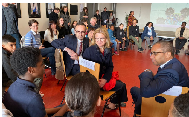
Présentation du projet «collège passerelle du Grand-Parc» à Bordeaux le 2 mars 2023 en présence du ministre.