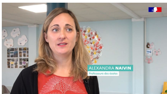
Épisode 1 École maternelle de Cabanac-et-Villagrains en Gironde