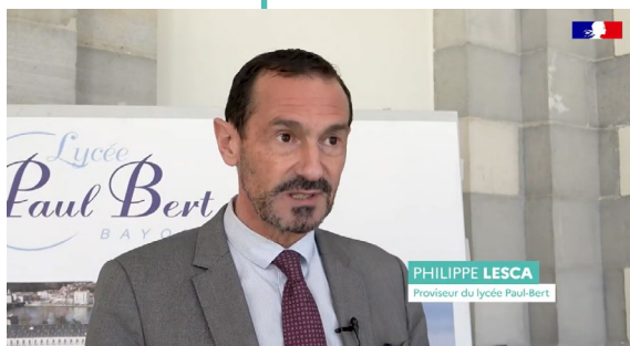
Épisode 5 Lycée Paul-Bert à Bayonne dans les Pyrénées-Atlantiques