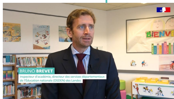
Épisode 4 École primaire de Biscarrosse-Plage dans les Landes