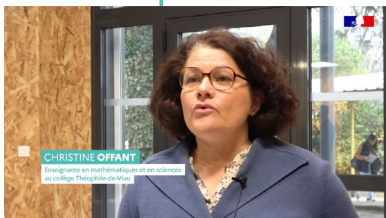
Épisode 3 Collège Théophile-de-Viau au Passage dans le Lot-et-Garonne