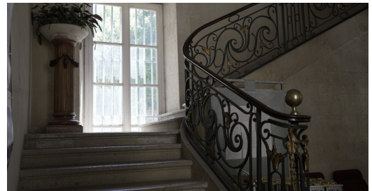
Rampe en fer forgé de l'hôtel de Poissac

L'hôtel de Poissac, à l'exclusion des parties classées, a été inscrit aux monuments historique par arrêté du 14 avril 1930. La façade sur le cours d'Albret, l'escalier et les trois salons avec boiseries ont été classés par décret du 21 février 1939. Le jardin, y compris sa clôture ainsi que les deux pavillons et le portail d'entrée donnant sur le cours d'Albret ; la porte sur la rue Pierlot, avec ses vantaux font partie du classement par arrêté du 29 mai 1961.