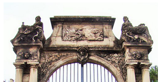
Portail de l'hôtel de Poissac