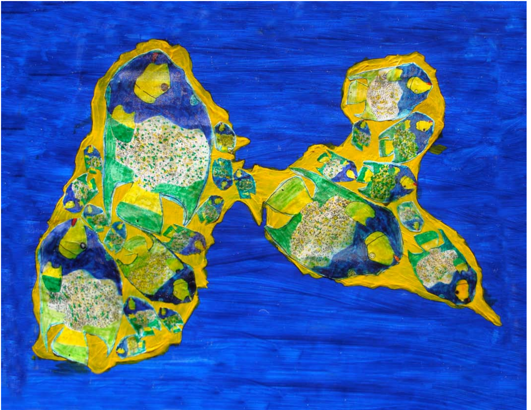
Classe de CM1, école François Villon - Bassens. « Papillon royal », évocation de la Guadeloupe