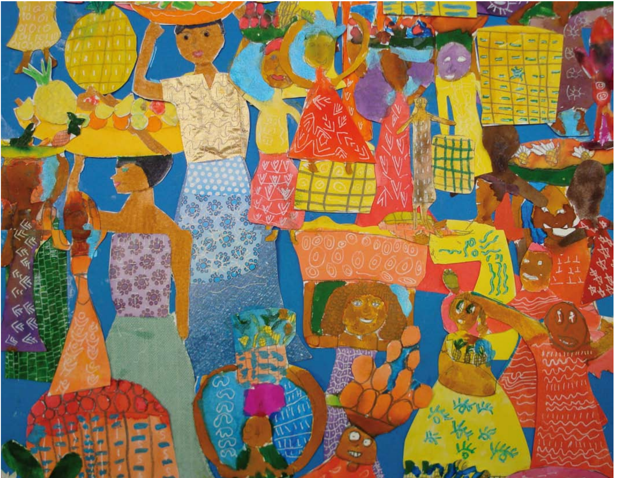
Classe de CE1-CE2, école Jean Cocteau - Bordeaux Caudéran. « Scène de marché », évocation de la Martinique