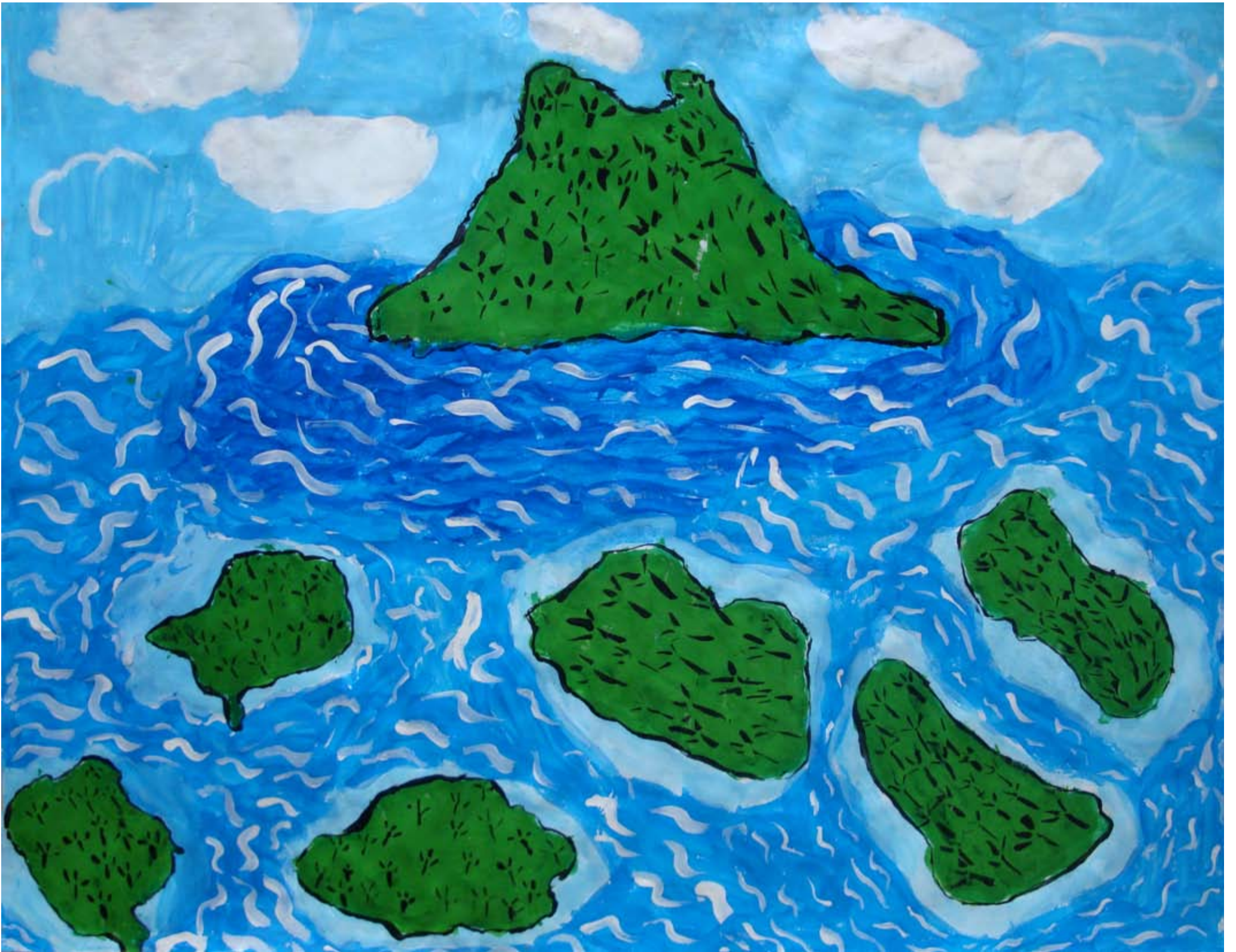
Classe de CM1, école de Lège bourg - Lège cap Ferret. « Archipel », évocation de la Polynésie Française