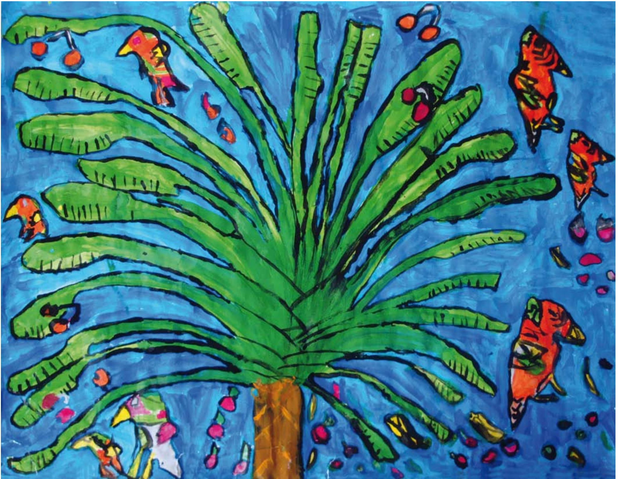
Classe de CE1, école de Lège Bourg - Lège Cap Ferret. « Arbre du voyageur », évocation de la Réunion