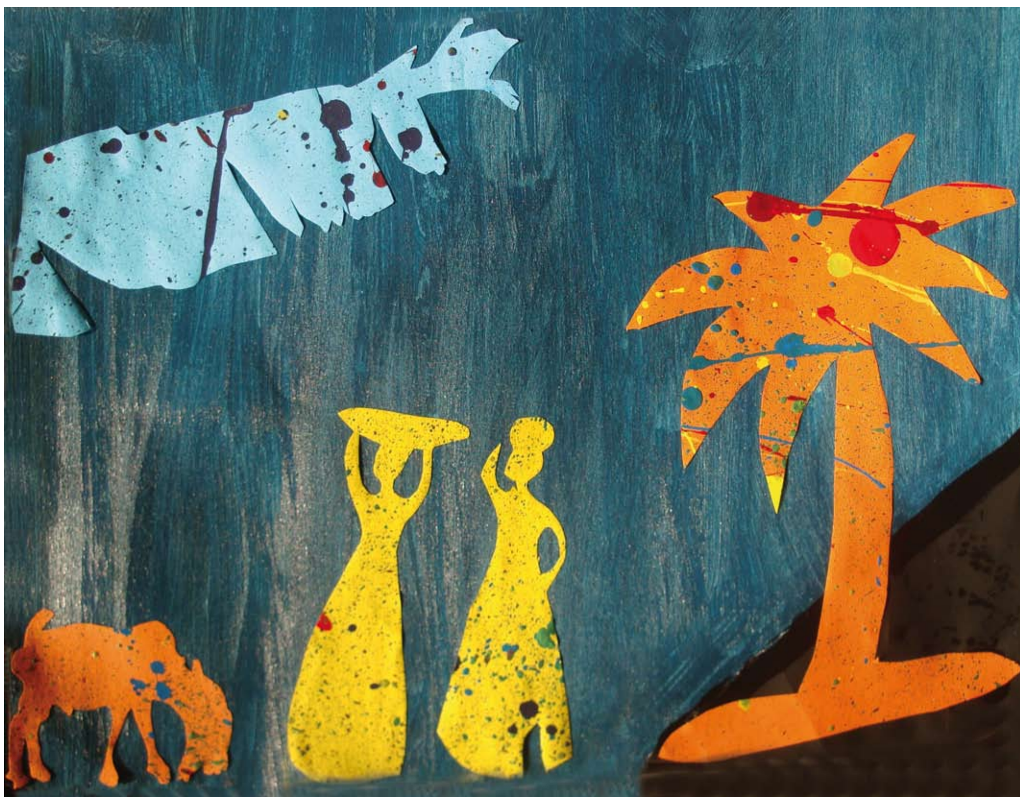
Classe de CM1-CM2, école de Saint-Pey- de-Castets. « Scène de vie », évocation de Mayotte