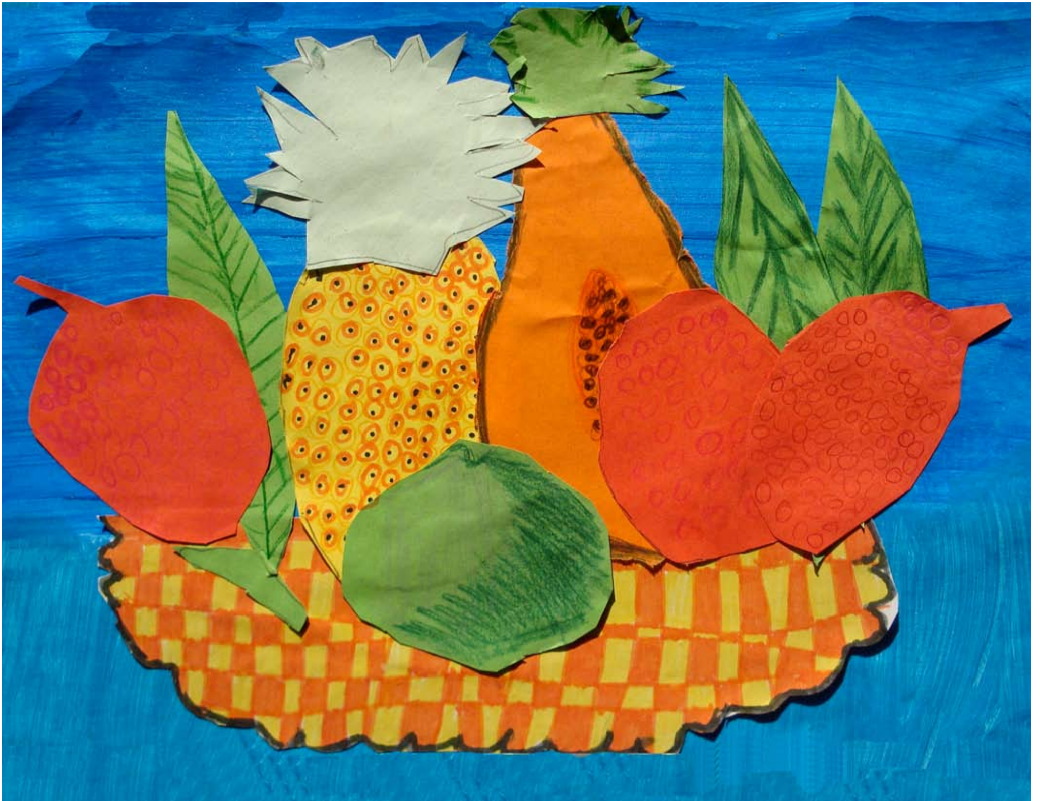
Classe de CE1, école Valeton de Boissière - Audenge. « Nature morte aux fruits tropicaux », évocation de Saint-Barthélémy