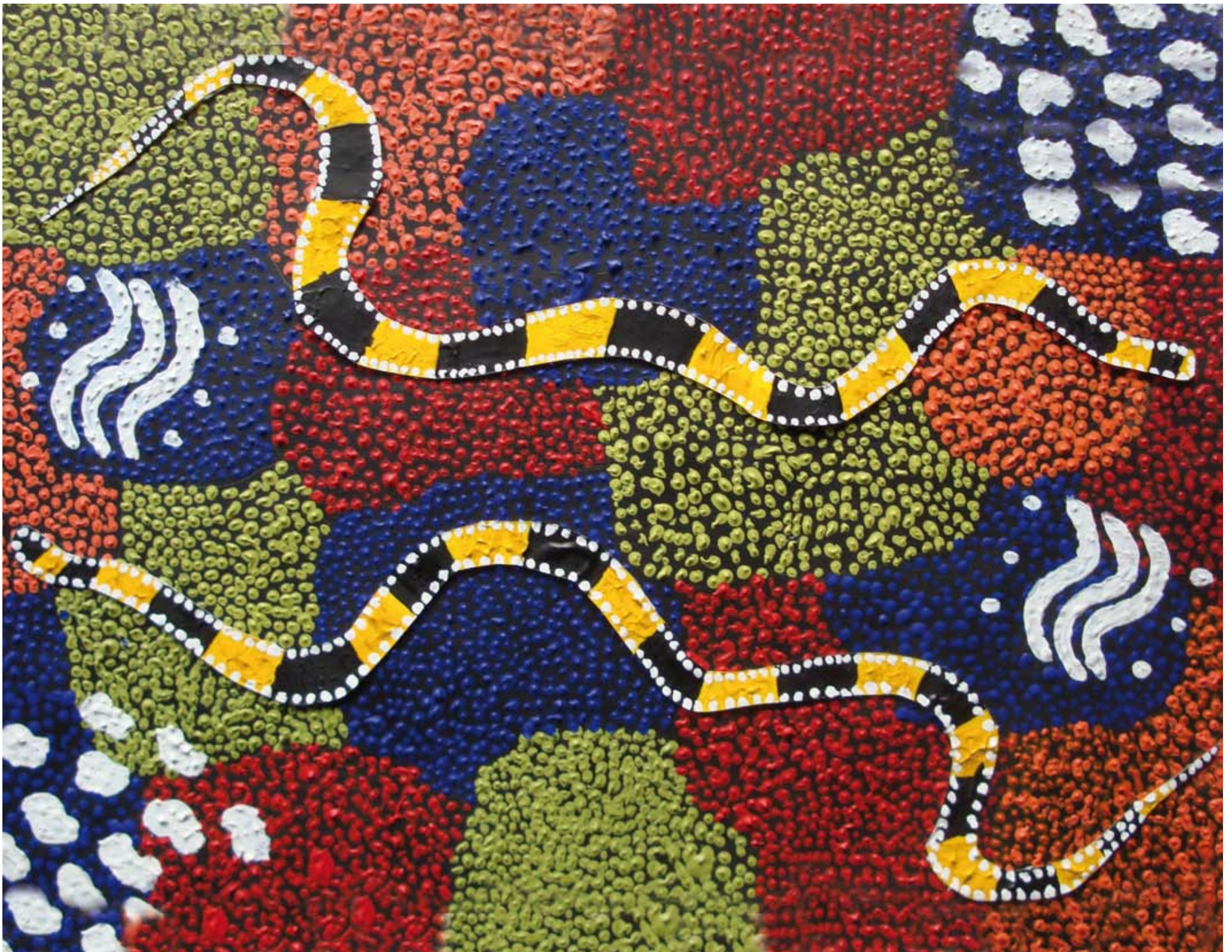
Classe de CM1, école François Villon - Bassens. « Tricot rayé », évocation de la Nouvelle Calédonie