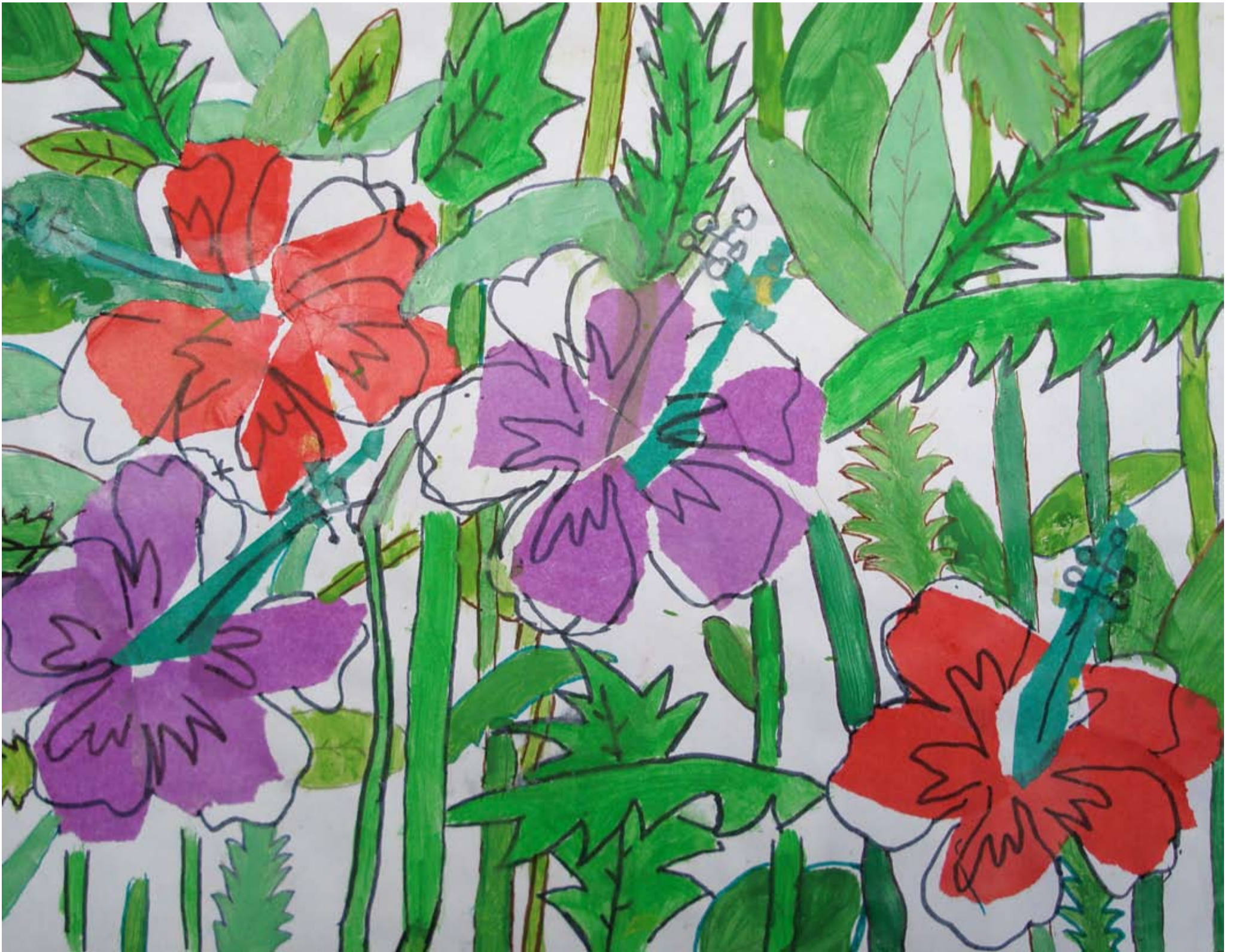
Classe de CM1-CM2, école de Saint-Pey-de-Castets. « Les hibiscus », évocation de St Martin