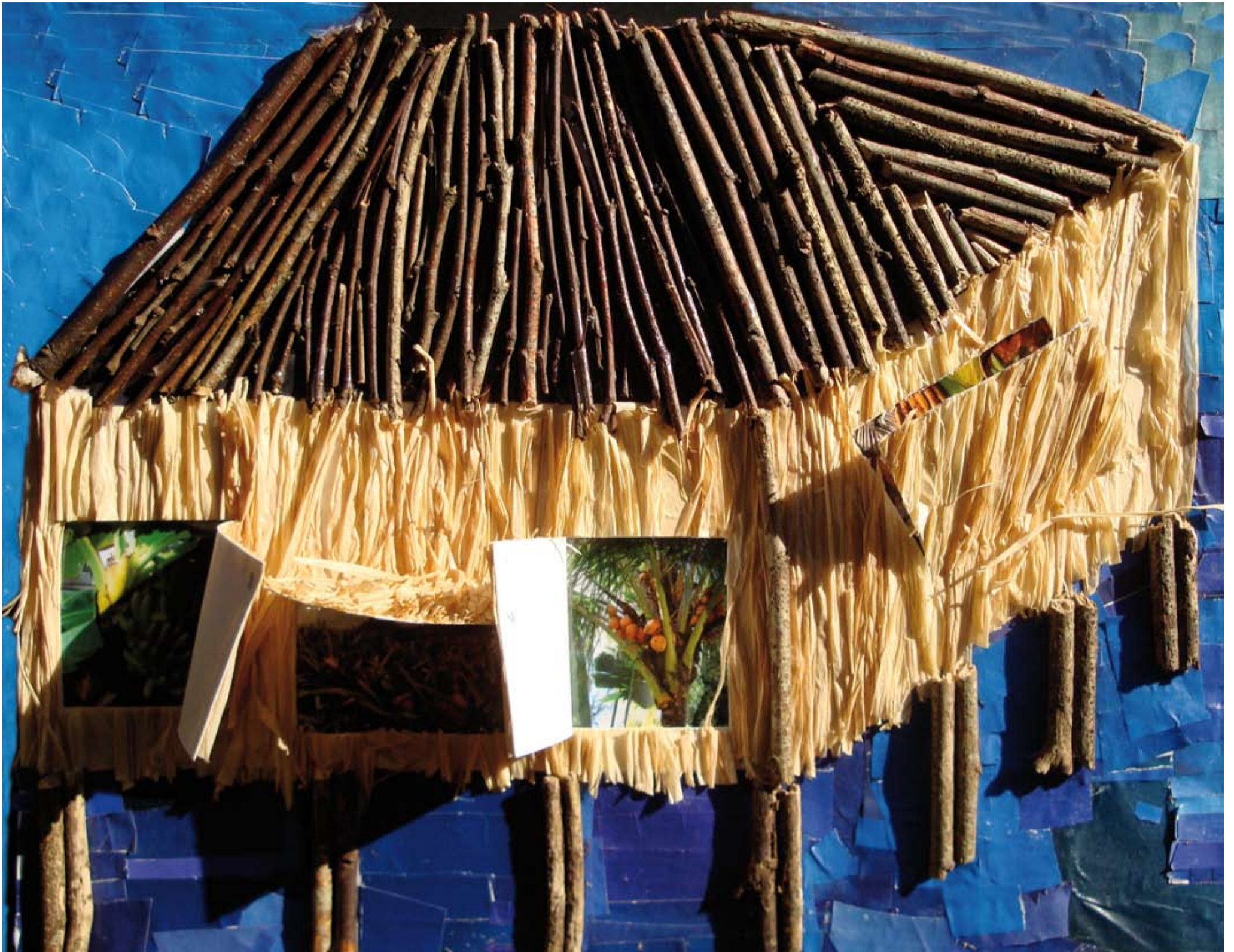
Classe de CM1, école François Villon - Bassens. « Paillote fruitée », évocation de Wallis-et-Futuna