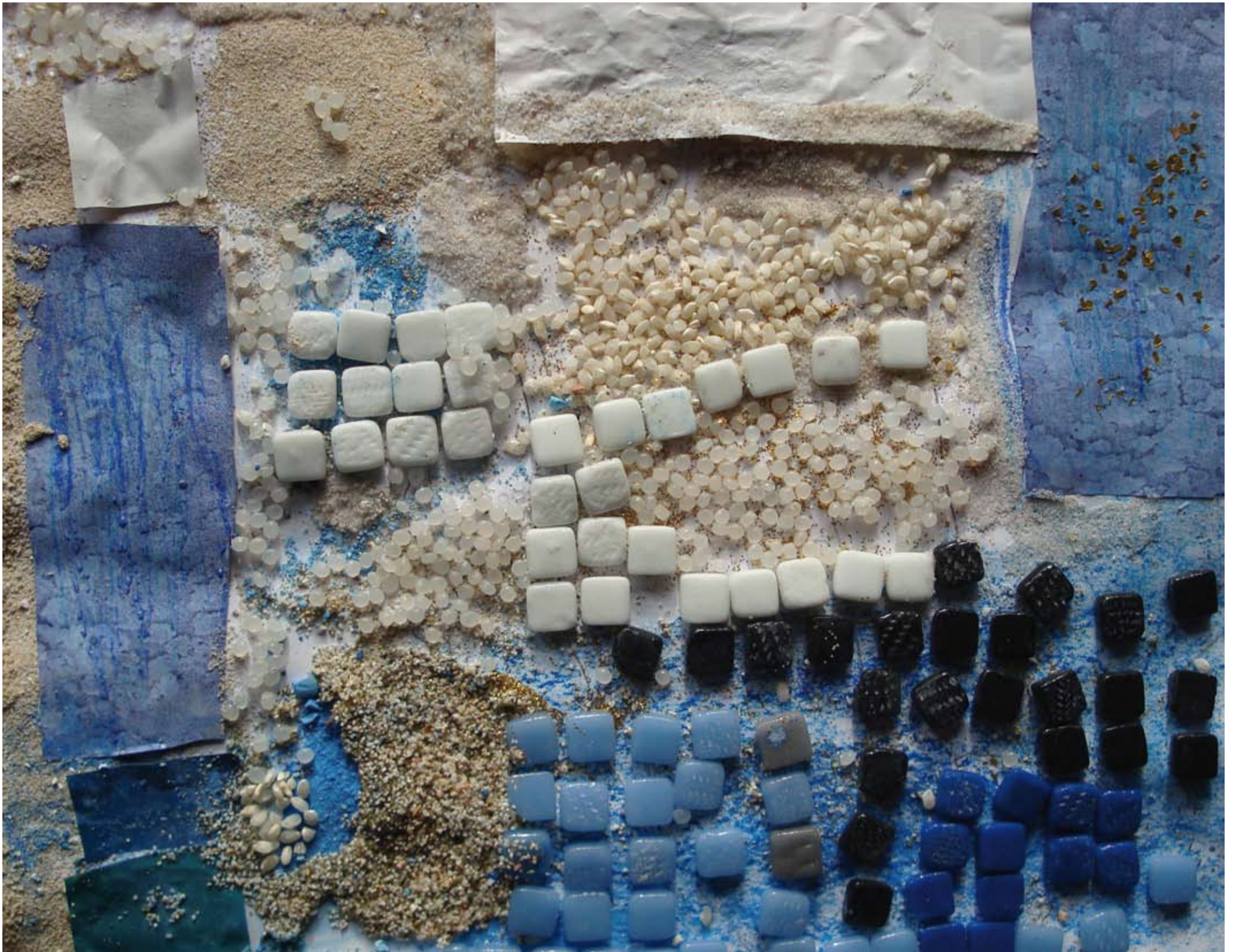
Classe de CE2-CM1, école du Bétey-Andernos. « Immensité glacée ». Evocation des Terres Australes et Antarctiques Françaises.