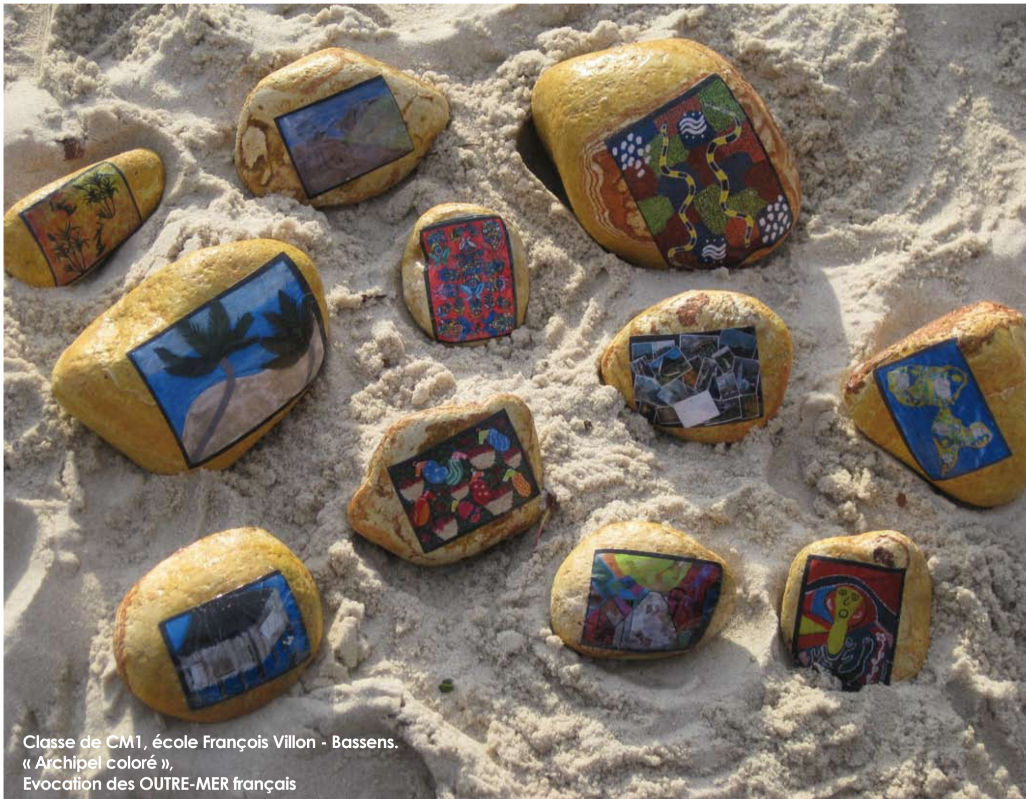
Classe de CM1, école François Villon - Bassens. « Archipel coloré », Evocation des OUTRE-MER français

A l'occasion de « 2011, année des OUTRE-MER », un concours est proposé aux classes de cycle 3 de l'académie de Bordeaux.