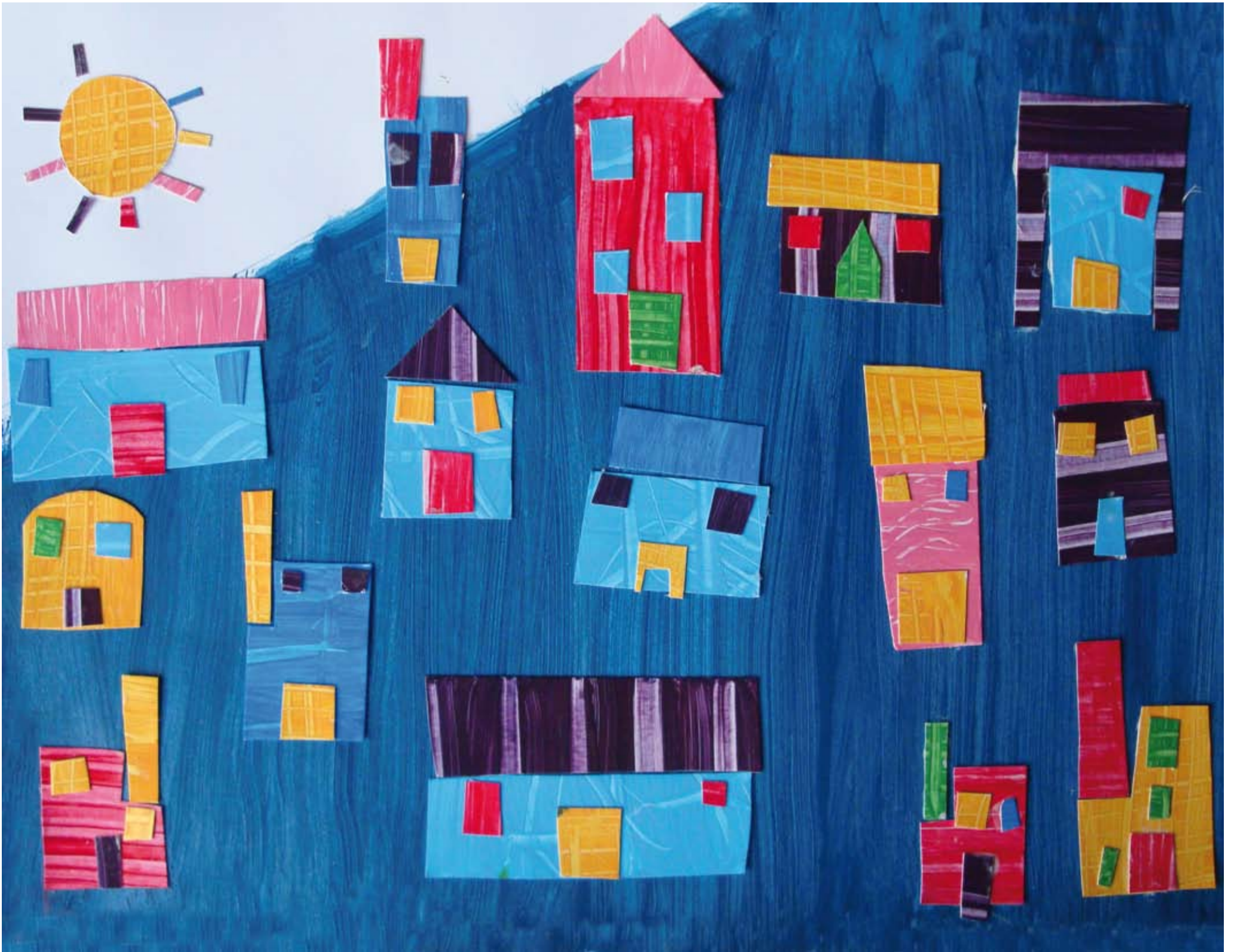
Classe de CM1-CM2, école de Saint-Pey-de-Castets. « Village de pêcheurs », évocation de Saint-Pierre-et-Miquelon